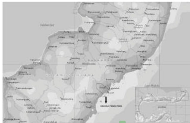
Gambar 1. Peta lokasi penelitian

Secara administrasi daerah penelitian terletak di kabupaten Minahasa Selatan dan Kabupaten Bolaang Mongondow, Propinsi Sulawesi Utara. Batas kedua kabupaten ini membagi daerah penelitian, berhimpitan dengan sungai buyat. Batas daerah penelitian secara geografis berbentuk segilima. Daerah penelitian berada lebih kurang 200 km baratdaya Manado, dan dapat dicapai dengan kendaraan roda empat selama kurang lebih 4 jam. Desa desa di sekitar daerah penelitian adalah Desa Buyat (termasuk ke dalam daerah penelitian) dan Desa Rataotok (tidak termasuk dalam daerah penelitian).