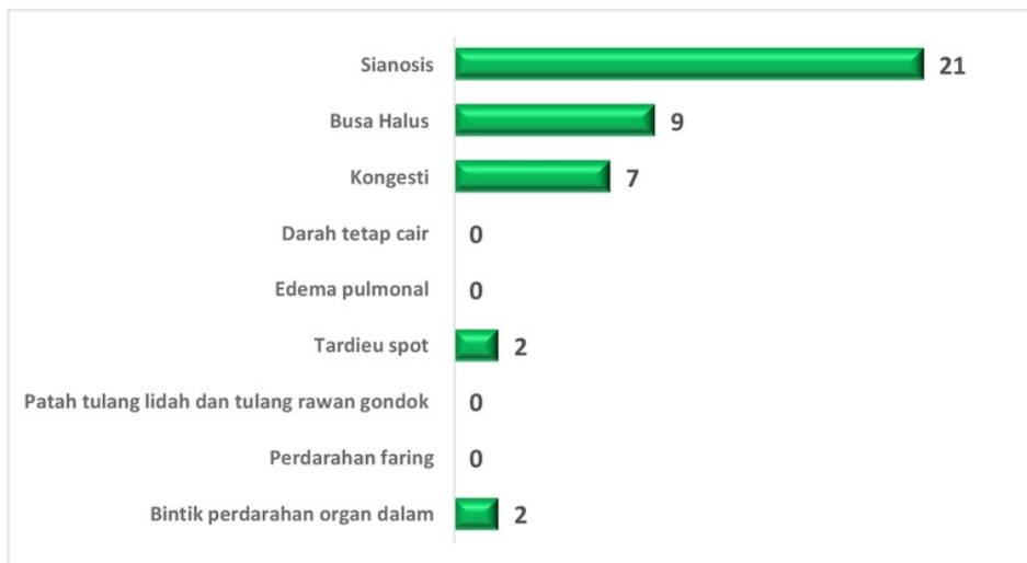
Gambar 3. Grafik jumlah kematian dengan asfiksia berdasarkan tanda-tanda asfiksia yang ditemukan pada jenazah

Jika dilihat dari kelompok usia, kematian dengan asfiksia terbanyak dialami pada kelompok usia 17-24 tahun yaitu sebanyak 7 kasus (33.3%). Hal ini sejalan dengan penelitian yang dilakukan oleh Khalil et al. 5 di Peshawar, Pakistan periode tahun 2009-2012, yang mendapatkan angka kematian terbanyak pada kelompok usia remaja akhir sampai dewasa muda sebesar 64.5%.