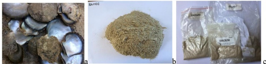
Gambar 2. (a) Limbah cangkang P. margaritifera (b) Tepung cangkang (c) sampel untuk di uji