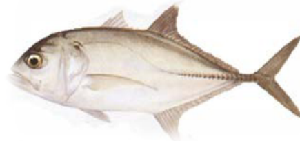
Gambar 1. Ikan Kuwe Putih Caranx sexfasciatus (Randall, dkk., 1997)

Ikan kuwe putih sebanyak 60 ekor dengan berat 57-70 g/ekor digunakan sebagai ikan uji (Gambar 1). Ikan tersebut ditebar masing-masing sebanyak 5 ekor ke dalam 12 petak jaring dimana setiap petak berukuran 3x1x1 m (Gambar 2). Kemudian ikan uji diberi 4 perlakuan berupa pakan dengan kandungan bahan yang berbeda selama 7 minggu.