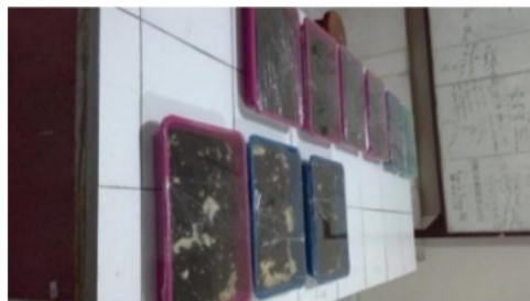
Gambar 2. Pertumbuhan kapang pada beberapa media