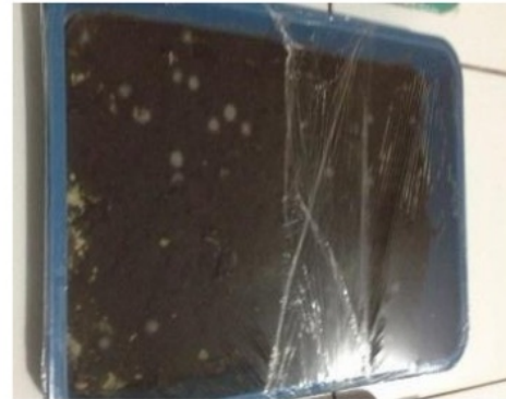
Gambar 3. Pertumbuhan kapang pada media pisang

Pada media dimana terjadi pertumbuhan A. niger (Gambar 3), tercium bau harum alkohol yang membuktikan adanya aktifitas fermentasi sempurna dari kapang tersebut. Dari penampakan media, keseluruhan permukaan media diselimuti koloni A. niger secara merata.