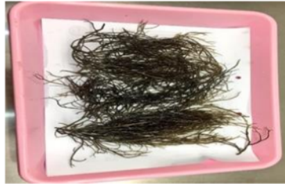
Gambar 2: Alga Gracillaria sp.

fase eksponensial, selain itu pada waktu inkubasi diatas 20 jam, bakteri-bakteri lain (bakteri susu) mulai muncul dan terkontaminasi media, sehingga dapat mengganggu pengamatan.