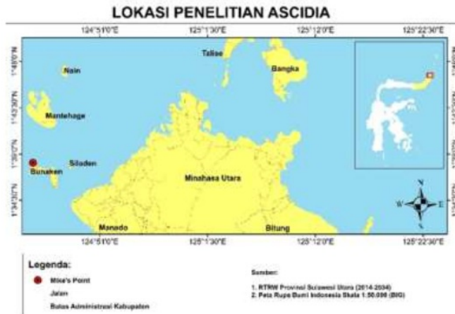
Gambar 1. Lokasi Pengambilan Data Ascidian