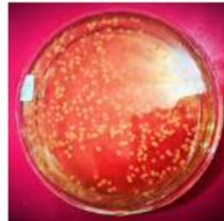
Gambar 6. Isolat kandidat bakteri probiotik yang diisolasi dari saluran pencernaan ikan lele ( Clarias batracus )

isolat yang berbeda yaitu, putih susu, putih dan kuning. 23 nampakan koloni bakteri berwarna putih bentuk koloni tidak beraturan, permukaan koloni tidak 23 a sedangkan untuk koloni berwarna kuning, bentuk koloni bulat dengan permukaan rata. Koloni bakteri berwarna putih susu, berbentuk bundar adalah koloni bakteri yang dominan tumbuh yang selanjutnya dipilih sebagai kandidat bakteri yang digunakan dalam perlakuan (Gambar 6).