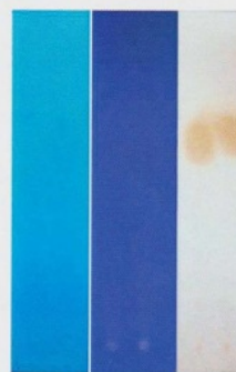
Gambar 2. Hasil KLT Fraksi E. spinosum dengan pelarut n -heksana-etil asetat

Isolasi senyawa antioksidan yang dilakukan pada ekstrak fraksi etil asetat alga Eucheuma spinosum mendapatkan isolat murni berbentuk pekat dan kering berwarna coklat kemerahan dengan massa sebesar 177 mg.