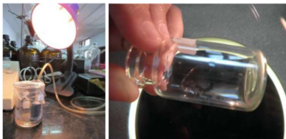
Gambar 1. Pengujian Toksisitas

Pengujian toksisitas rumput laut dengan metode BSLT dilakukan hanya terhadap fraksi aktif antioksidan ekstrak RL E. spinosum yaitu fraksi etil asetat dan fraksi butanol. Data hasil uji toksisitas diperlihatkan pada Tabel 1.