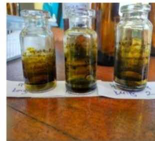
Gambar 2. Bercak Minyak Hasil Ekstraksi Chlorella sp. dan Spirulina sp.