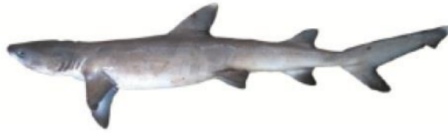
Gambar 3. Struktur tubuh Triaenodon obesus (White et al. 2006).

bahwa prosentase tingkat kemiripan sekuens yang berada pada nilai \geq 99\% menunjukkan bahwa spesies yang dibandingkan merupakan spesies yang sama.