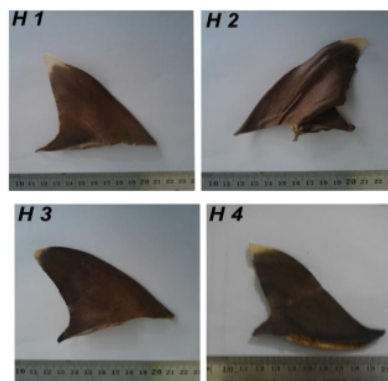
1 Gambar 1. Bentuk dan tampilan sirip ikan hiu yang didapat di Tumbak, Minahasa Tenggara.

Total sirip hiu yang diperoleh dari pengumpul yang ada di Tumbak Minahasa Tenggara, berjumlah empat sirip dari individu berbeda. Bentuk dan tampilan keempat sirip hiu tersebut ditampilkan pada Gambar 1.