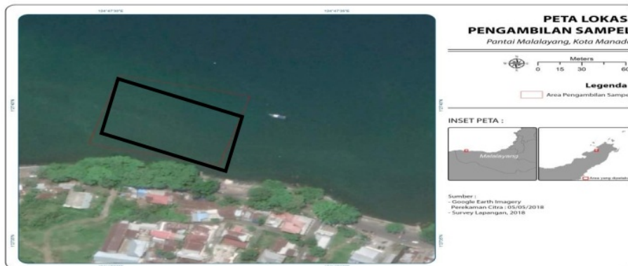
Gambar 1. Peta Pengambilan Sampel

Sampel air laut diambil di Perairan Malalayang, Sulawesi Utara (Gambar 1). Pengambilan sampel air laut dilakukan dengan mengambil air laut saat air laut surut dan dimasukkan ke dalam botol. Setelah itu sampel tersebut dibawa ke Laboratorium Biologi Molekuler dan Farmasetika Laut Fakultas Perikanan dan Ilmu Kelautan untuk diisolasi bakteri yang hidup didalamnya.