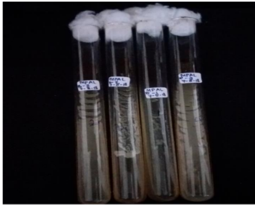
Gambar 3. Isolat Bakteri pada Media Miring

Bakteri laut hasil penelitian ini, lebih lanjut dapat diteliti potensinya. Bakteri laut dilaporkan memiliki banyak manfaat seperti penghasil proteorhodopsin dari untuk aplikasi sel tenaga surya (Tapilatu, 2012), berperan sebagai hidrokarbonoklastik PAH fenotiazin (Yeti dkk, 2016) dan juga bakteri laut dibuktikan dapat mendegradasi minyak (Shaumi dkk, 2018)