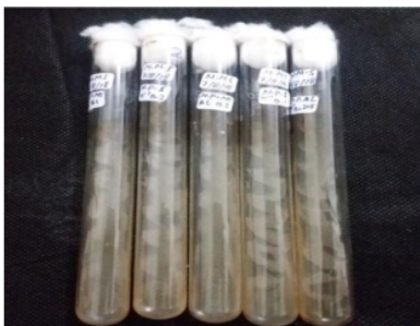
Gambar 3. Pertumbuhan Koloni Bakteri pada Agar Miring

Widiyaningsih, dkk. (2018) melaporkan menisolasi 10 isolat bakteri simbion dari karang lunak Sinularia sp, dimana hanya satu isolat bakteri saja yang teridentifikasi memiliki kekerabatan dengan Pseudomonas stutzeri . Isolat bebas yang telah dikarakterisasi ditumbuhkan ke dalam media miring untuk dijadikan stok bakteri terlihat pada Gambar 3.