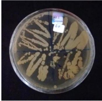
Gambar 2. Hasil isolasi bakteri simbiosis spons yang tumbuh dalam media NA.

Berdasarkan hasil pengamatan morfologi, didapatkan 5 isolat bakteri simbiosis spons yang menyerupai Cribochalina sp.