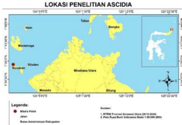
Gambar 1. Lokasi Pengambilan Data Ascidian