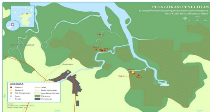
Gambar 1. Lokasi penelitian

Penelitian ini dilakukan selama ± 2 bulan, dimulai dari bulan November – Desember 2019, di hutan mangrove Desa Sarawet (Dusun Kuala Batu), Kecamatan Likupang Timur, Kabupaten Minahasa Utara. Desa Sarawet (Dusun Kuala Batu), memiliki hutan mangrove dengan luas ± 138 ha.