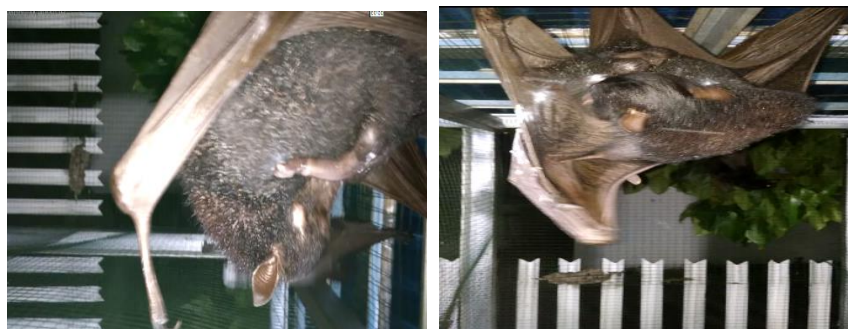
Gambar 1. Autogrooming kelelawar menjilat-jilat moncong dan menjilat-jilat badan

dilakukan sambil menggantung maupun sambil duduk di cabang pohon. Kelelawar merupakan hewan yang rajin membersihkan tubuhnya, meskipun mereka memiliki bau yang khas tetapi tubuhnya tidak akan berbau apabila pakan yang diberikan cukup baik.