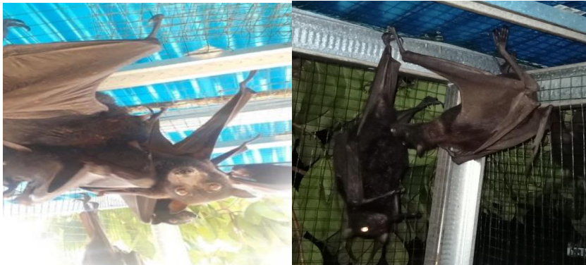
Gambar 3. Allogrooming kelelawar menjilat-jilat kelamin individu lain