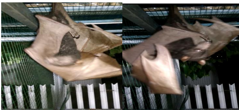
Gambar 2. Autogrooming kelelawar mengusap-usap sayap luar dan menjilat-jilat kaki