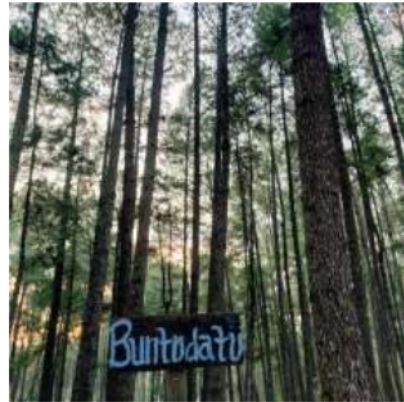
Gambar 2. Panorama Hutan Pinus

Potensi objek wisata merupakan salah satu komponen yang harus dimiliki oleh setiap objek wisata karena setiap kawasan wisata memiliki ciri dan keunikan tersendiri yang menjadi daya tarik objek wisata hutan pinus Buntudatu terdapat pohon pinus pada gambar 2.