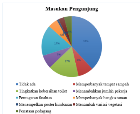
Gambar 3. Masukan Pengunjung Terhadap Pengelolaan HKPBB Kota Bekasi

8 Pengunjung memiliki peran pengendalian, hal tersebut sejalan dengan pendapat Tisnanta dan 24 mah (2016) yang menyatakan peran dalam pemanfaatan hutan kota merupakan upaya melibatkan masyarakat pada tahap perencanaan, pemanfaatan, dan pengendalian. Peran pengendalian dapat dilakukan pengunjung dengan melakukan evaluasi yaitu pemberian saran/masukan sehingga pengelolaan menjadi terkontrol dan menjadi optimal. Masukan yang diberikan pengunjung menunjukkan kepedulian responden dalam meningkatkan pengelolaan yang ada di HKPBB Kota Bekasi. Terdapat 60 (62%) responden yang memberikan saran atau masukan terkait pengelolaan di HKPBB Kota Bekasi.