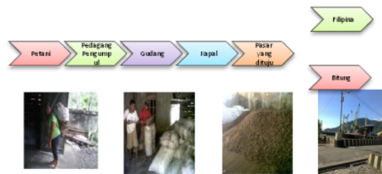
Gambar 3. Jalur Distribusi Logistik Komoditi Kelapa di Kabupaten Kepulauan Sangihe

bulan. Distribusi logistik untuk komoditi kelapa yaitu mulai dari Petani ke pedagang pengumpul dilanjutkan ke gudang sampai ke kapal dan kemudian dikirim ke pasar yang di tuju seperti pada gambar berikut :