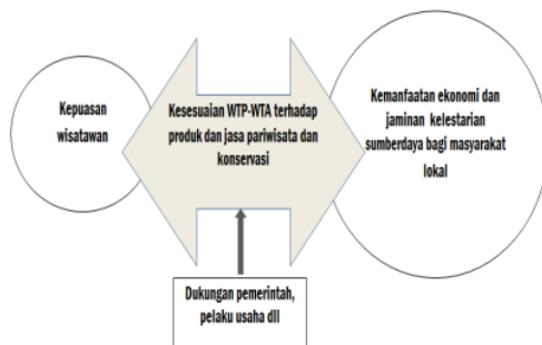
Gambar 1. Model analisis optimalisasi manajemen destinasi wisata berkelanjutan