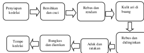
Gambar 2 Proses Pembuatan Tempe

Proses pembuatan tempe dapat di lihat pada Gambar 2.