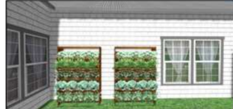
Gambar 6. Desain Penanaman Vertikal Dengan Rak