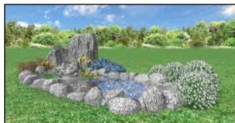
Gambar 8. Desain Kolam Ikan