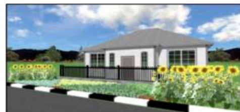
Gambar 7. Desain Pemanfaatan Sempadan Jalan