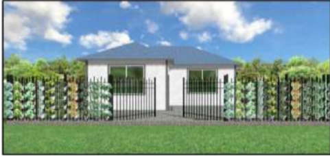
Gambar 1. Desain Penanaman Vertikal di Pagar Menggunakan Pot Gantung