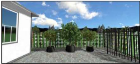
Gambar 3. Desain Menggunakan Pot untuk Tanaman Buah Dalam Pot (Tabulampot) di Lahan Dengan Perkerasan