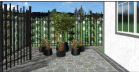
Gambar 4. Desain Penggunaan Pot untuk Tabulampot dan Sayur di Lahan Dengan Perkerasan