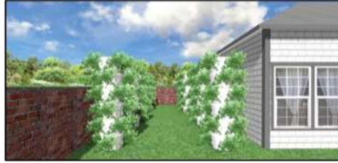
Gambar 5. Desain Penanaman Vertikal Dengan Pot Bersusun